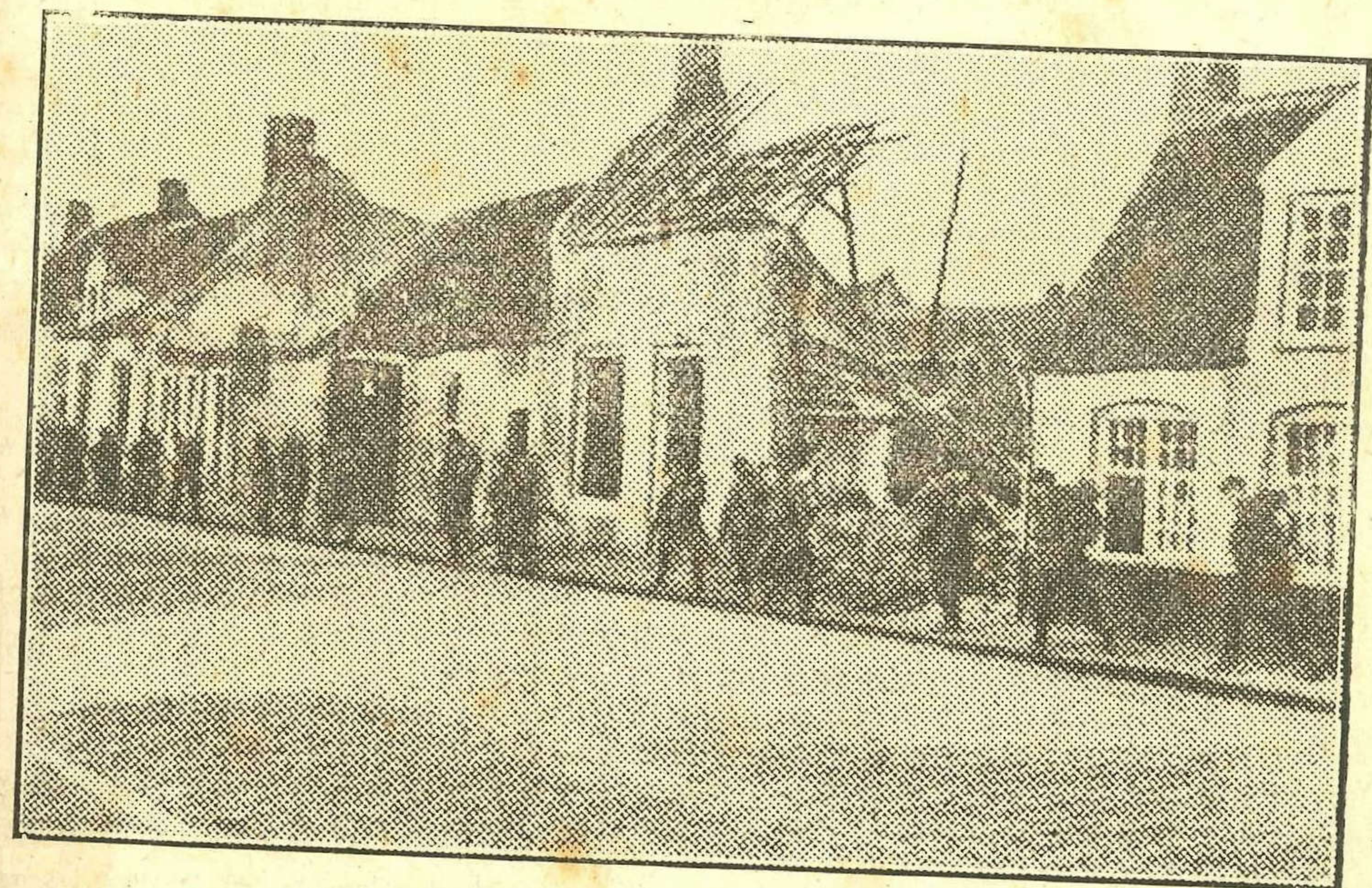
Fusiliers in het gebombardeerde Nieuwpoort

Toen ook waren er ijzeren kerels, van geen klein geruchtje vervaard. « Een soldaat, brood gekocht hebbende, toonde dit omhoog aan een makker; een kogel nam hem het half brood weg; het overige hield hij vast, zeggende, dat het een rechtschapen soldaatskogel was, die hem nog het grootste deel liet behouden. Een ander, zijnde in een uitval zijn rechterarm afgeschoten, raapte dien op, en deed dien met hem dragen tot den chirurgijn; vroolijk zijnde, zonder ziek te zijn, of te bed te leggen, nam hij dien arm