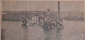
MET DOORSNIFFEN VAN FRIGATELOOFT IN HET «NEMANDELAND»

Uitgever J. HOSTE, 36, St-Pieterstraat, Brussel